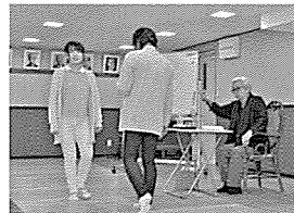
映画監督：山田洋次