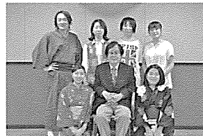
脚本家：ジェームス三木